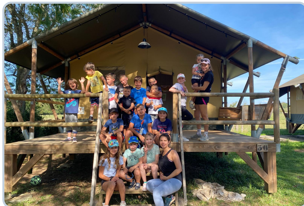
Week-end fratrie ?