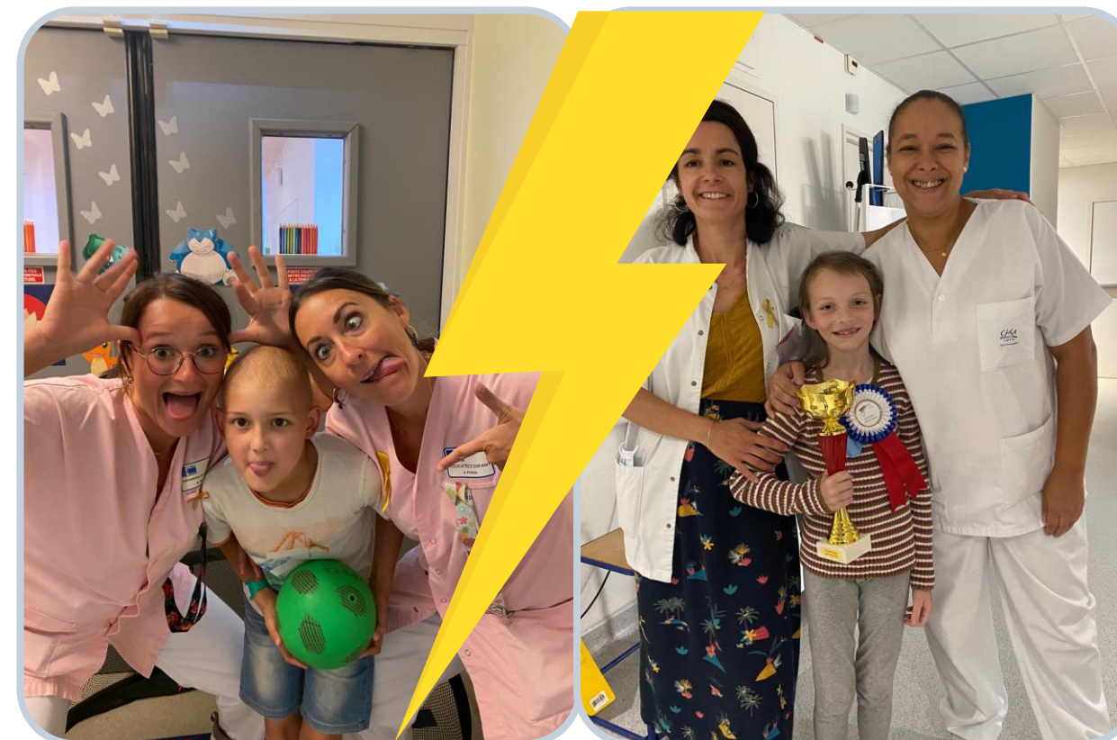
Semaine des Jeux Olympiques en juillet CHU Besançon VS CHU Dijon ???