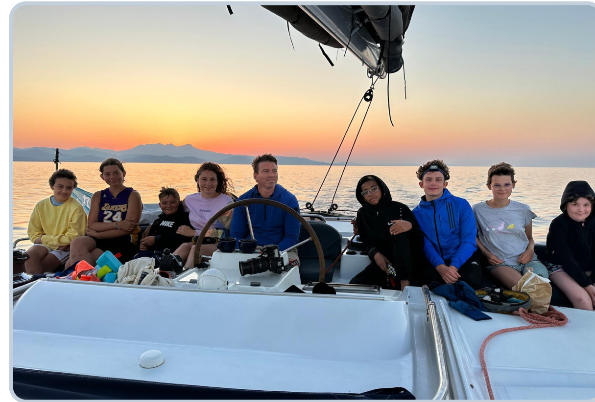
Séjour en catamaran autour de la Corse