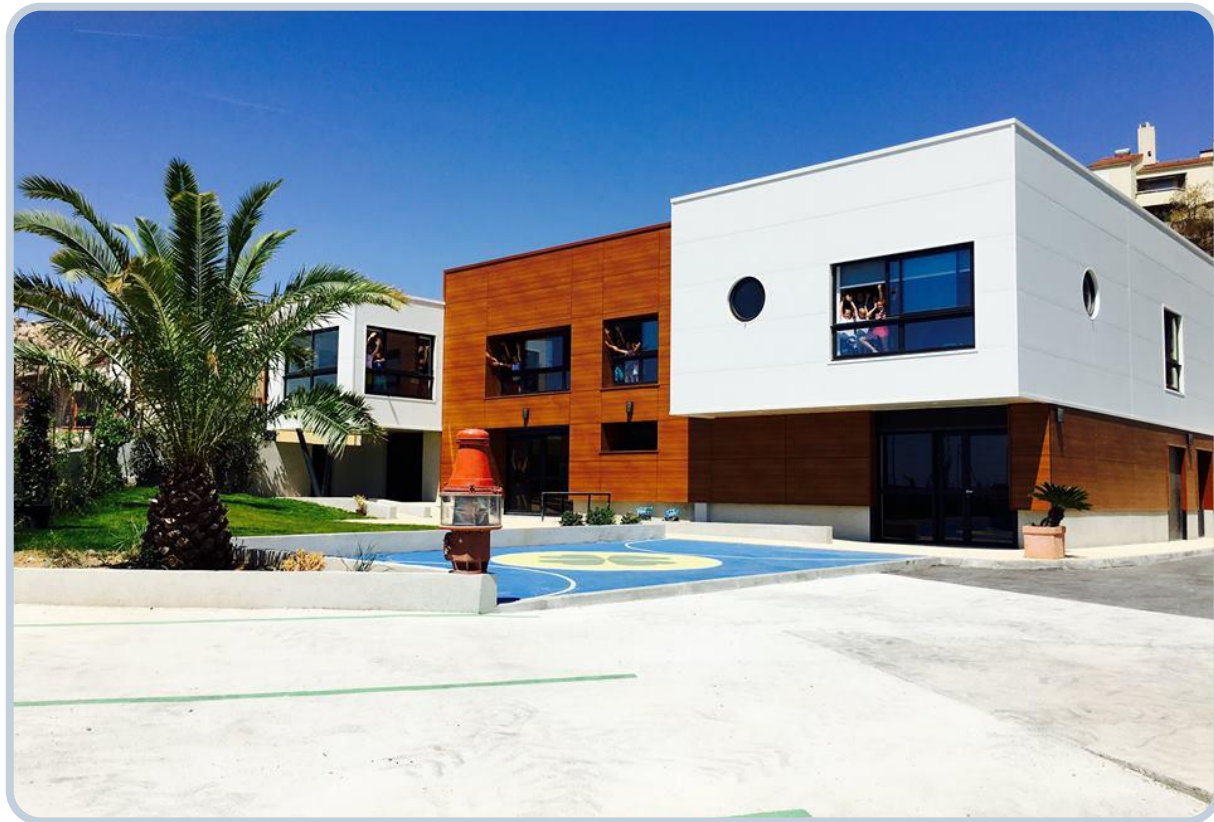
Séjour au phare des Sourires x2