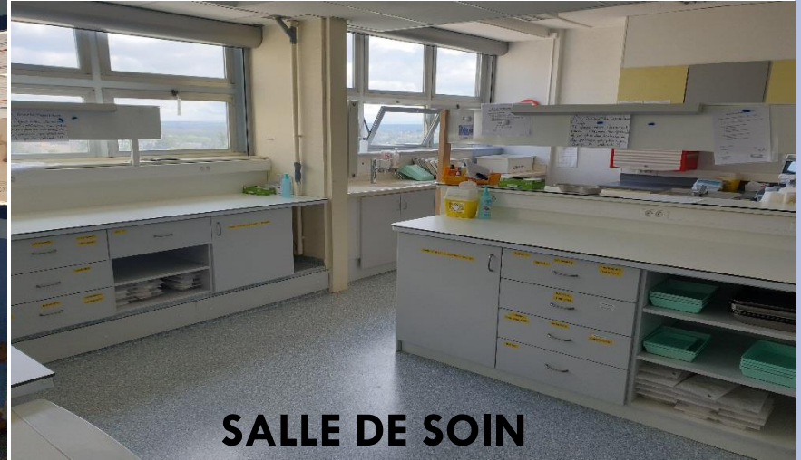
SALLE DE SOIN